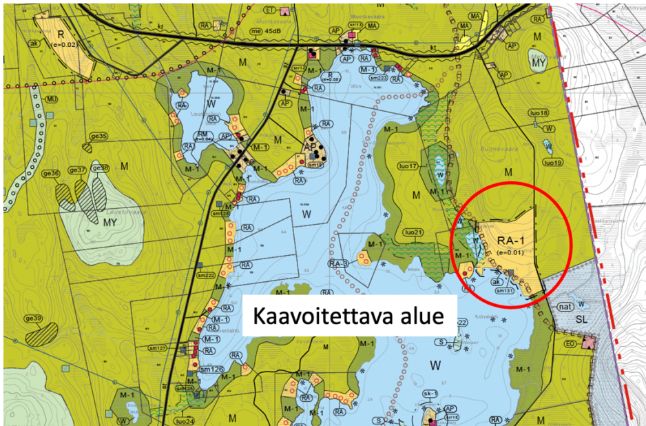
Kuva 3. Karttaote osayleiskaavakartasta, jossa osoitettu kaavoitettava alue punaisella ympyrällä.

Kaavoitettava määräala on voimassa olevan osayleiskaavan mukaista loma-asuntoaluetta (RA-1). Alue on tarkoitettu ei-omarantaisten loma-asuntojen rakentamiseen.