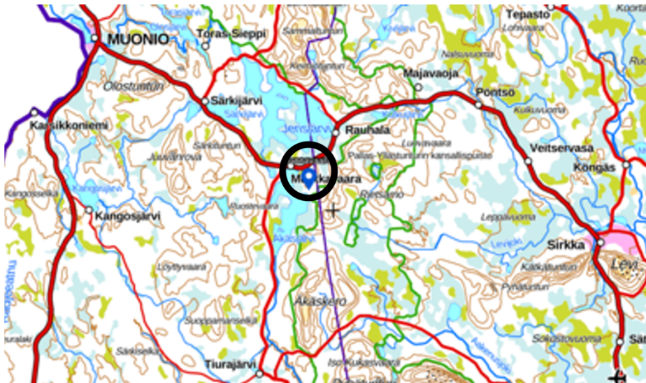
Kuva 1. Sijainti Muonion kunnassa

Alueella ei ole rakennuksia tai rakennelmia.